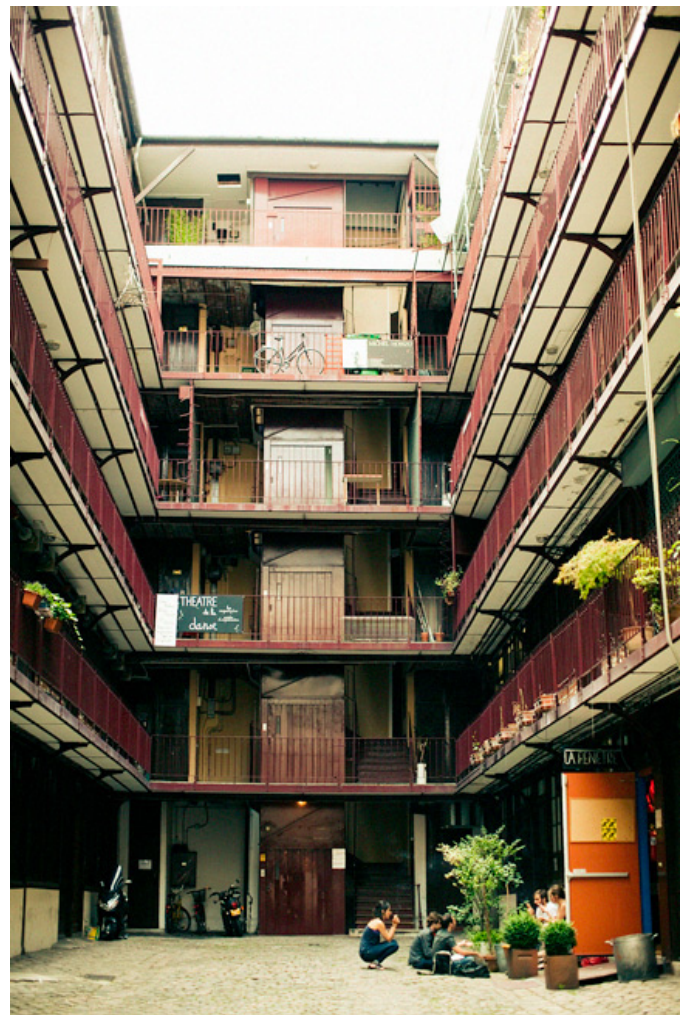
La cour du 77 rue de Charonne (La Loge au rez-de-chaussée, à droite)